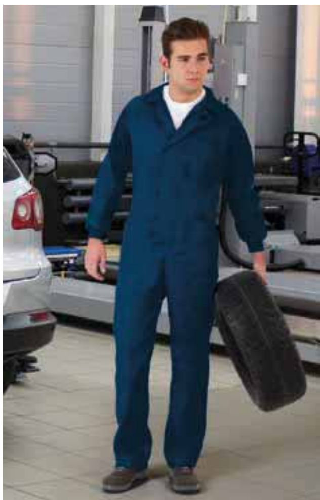
* Complemento T-shirt WAVE (página 30).