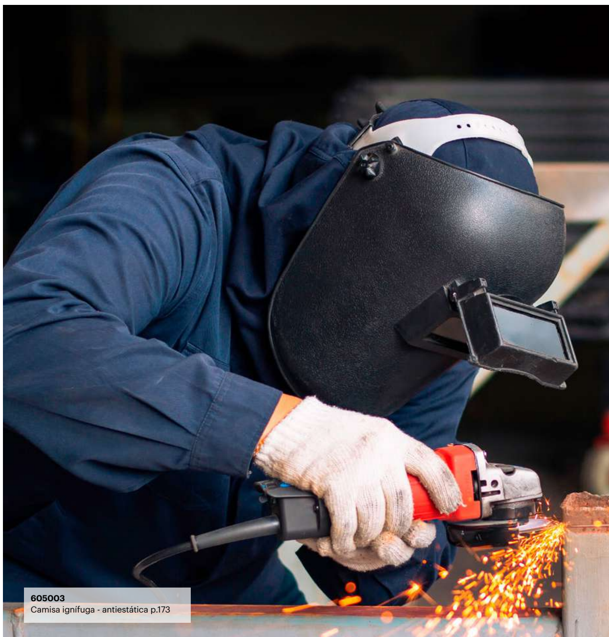
605003 Camisa ignífuga - antiestática p.173