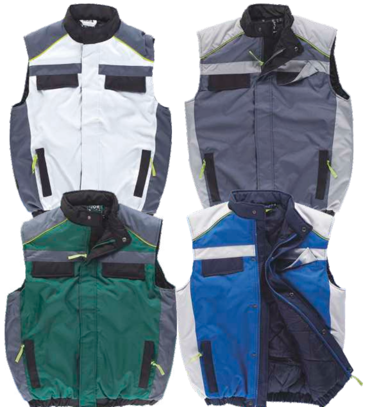
verde e./cinzento e./preto