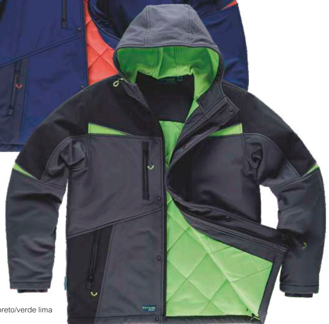
cinzento escuro/preto/verde lima