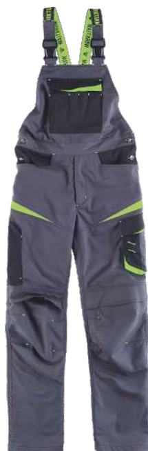
cinzento escuro/preto/verde lima