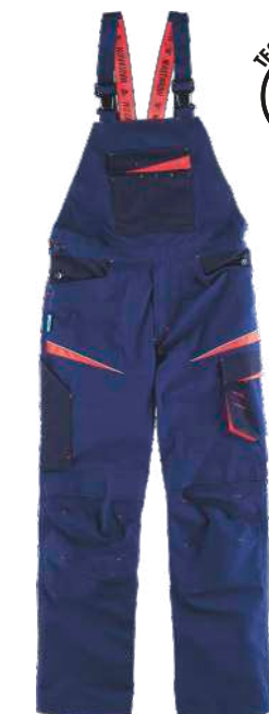
marinho/marinho escuro/vermelho a.v.