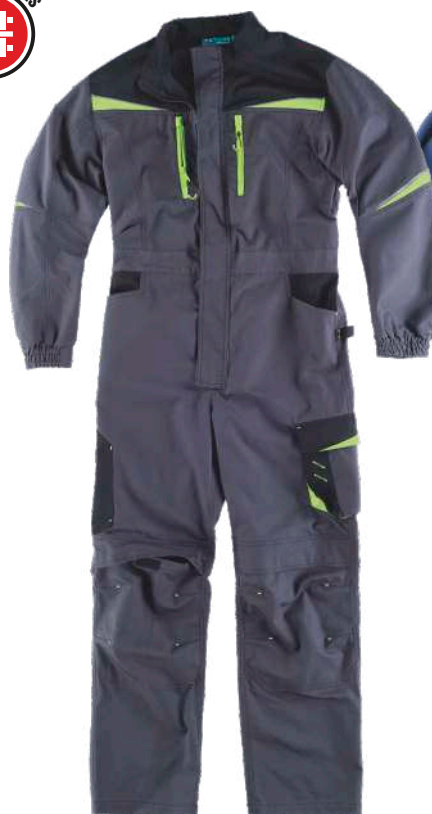
cinzento escuro/preto/verde lima

Tecido: 65% Poliéster 35% Algodão (270 g/m 2 )