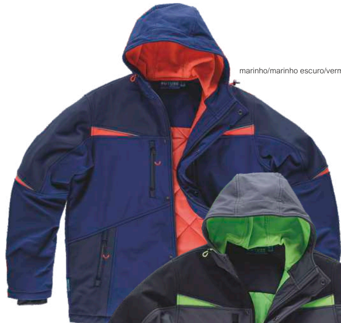
marinho/marinho escuro/vermelho a.v.

Tecido Interno (Acolchoado+Forro): 100% Poliéster (120 g/m2)