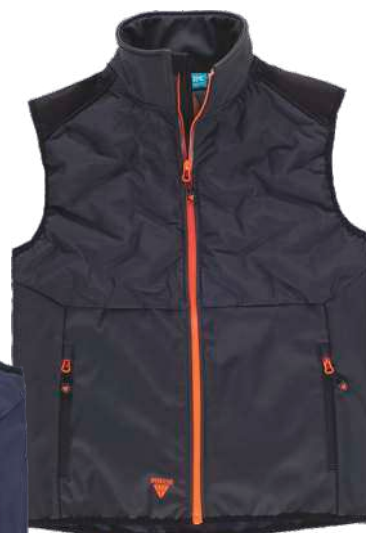
cinza escuro/preto/laranja flúor