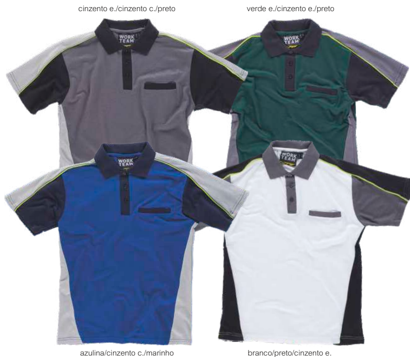
cinzento e./cinzento c./preto

Tecido: 65% Poliéster 35% Algodão (155 g/m2)