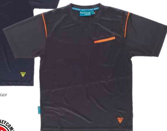
cinza escuro/laranja flúor