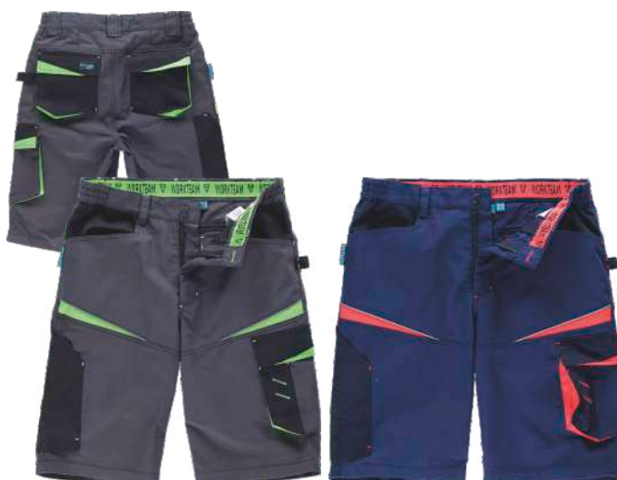
cinzento escuro/preto/verde lima

Tecido: 65% Poliéster 35% Algodão (270 g/m2)