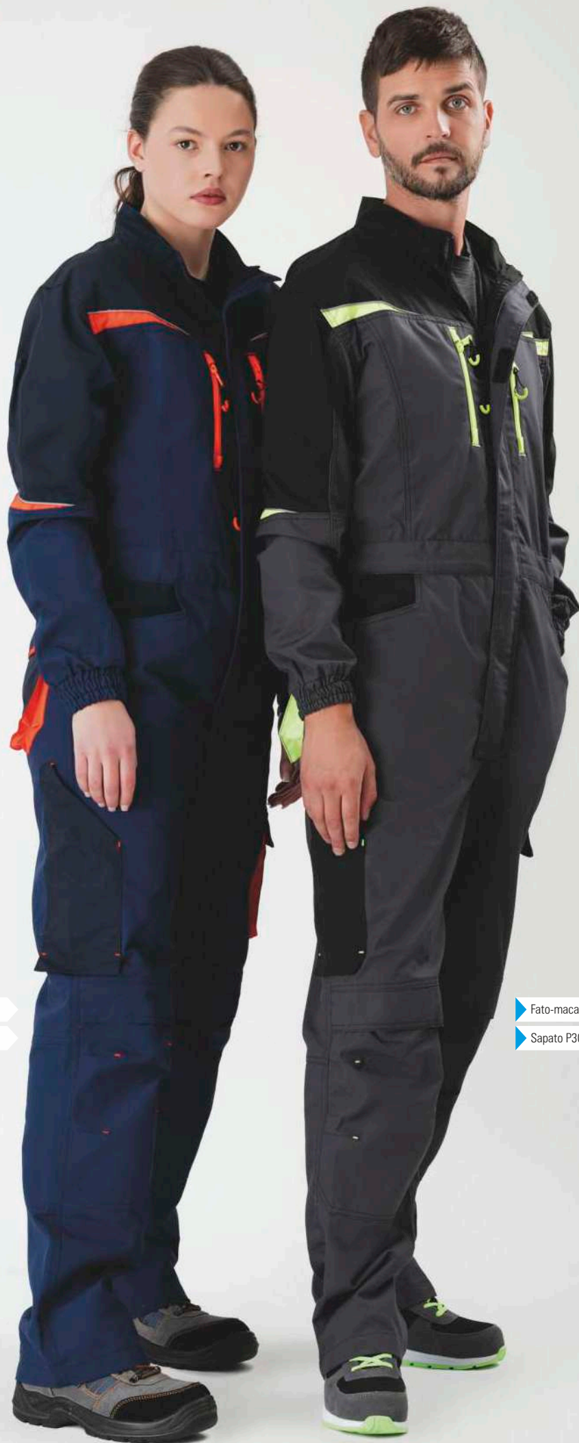
▶ Fato-macaco WF2720