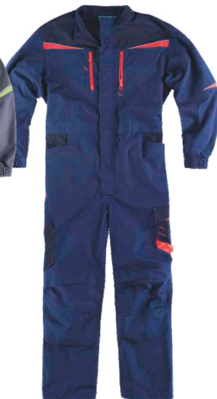
marinho/marinho escuro/vermelho a.v.