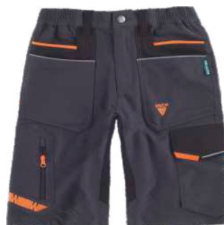
cinza escuro/preto/laranja flúor

Tecido: 93% Poliéster 7% Elastano (200 g/m2)