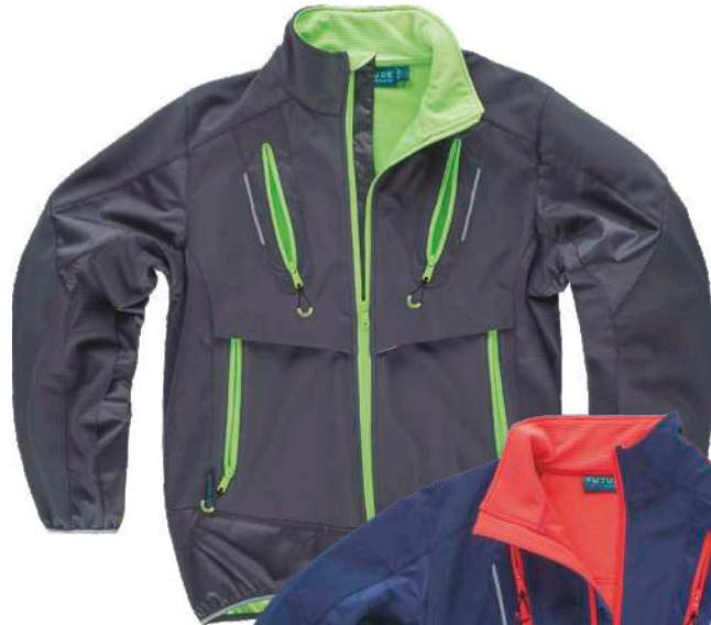
cinzento escuro/verde lima

Tecido: 94% Poliéster 6% Elastano (280 g/m2)