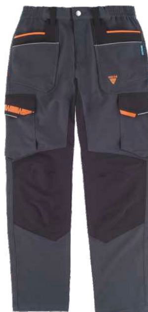
cinza escuro/preto/laranja flúor

Tecido: 93% Poliéster 7% Elastano (200 g/m2)