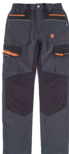
cinza escuro/preto/laranja flúor

Tecido: 93% Poliéster 7% Elastano (200 g/m2)