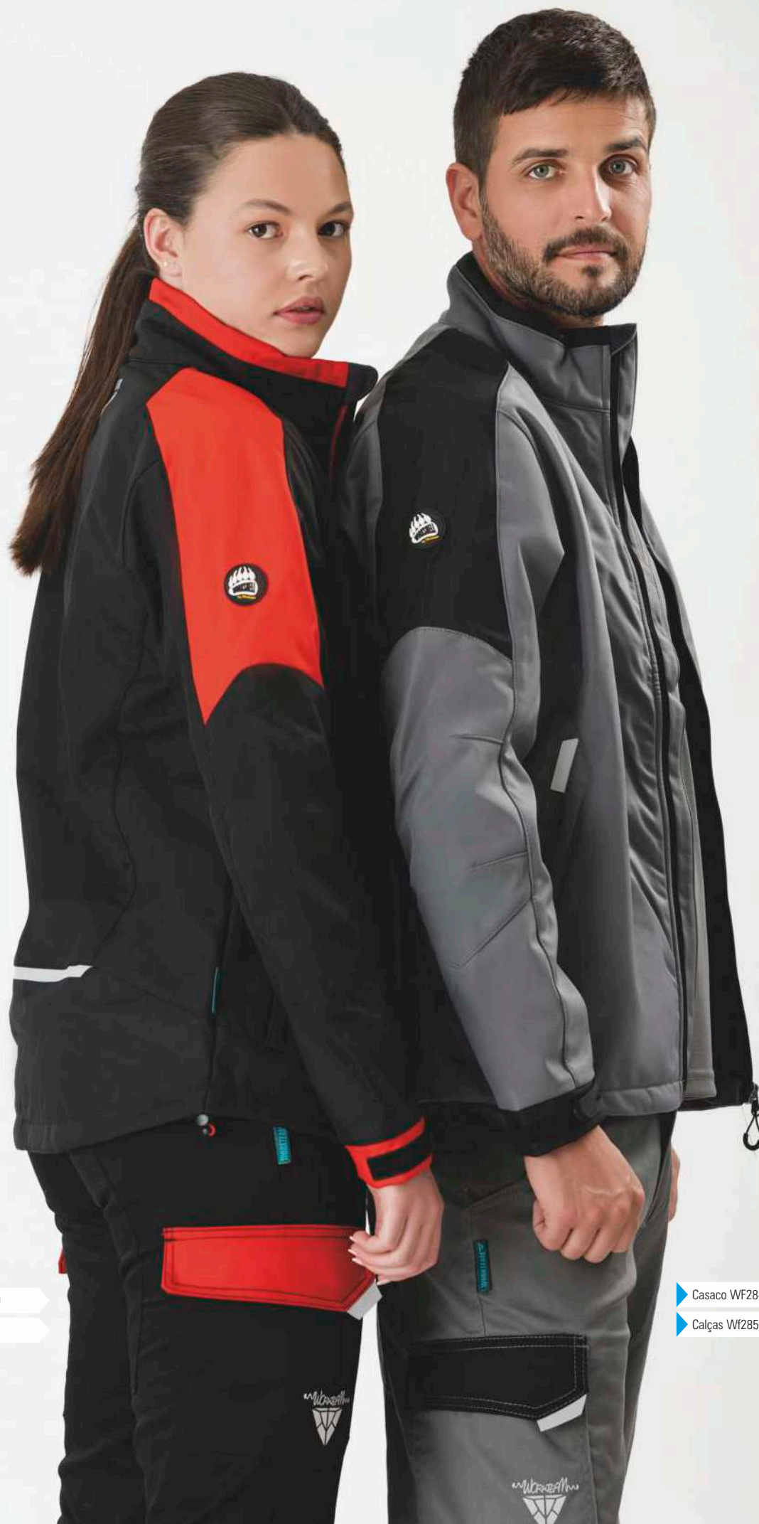
▶ Casaco Wf2840